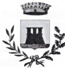
Comune di Castellaneta