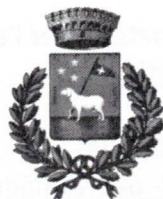
Comune di Laterza