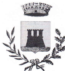
Comune di Castellaneta